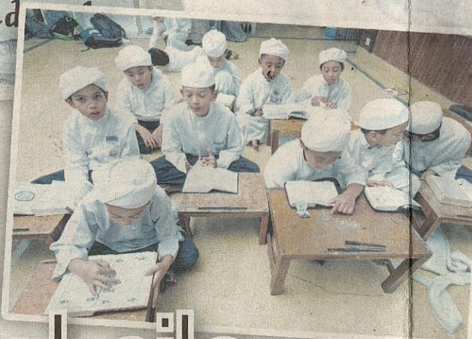
AKADEMI TAHFIZ AL-HIDAYAH kini menaungi 200 orang pelajar untuk diberi didikan duniawi dan ukhrawi.